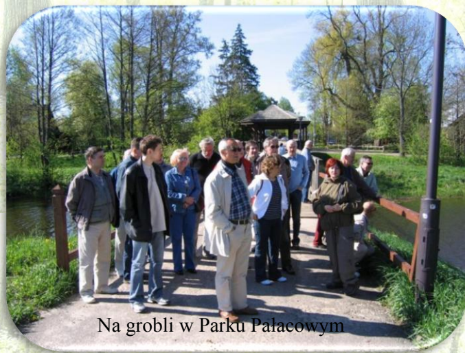
Na grobli w Parku Pałacowym

Biuro Turystyki Ryś od 14 lat dba o komfort i udane wakacje turystów. Proponujemy Państwu relaks z dala od zgiełku wielkich miast, w sercu pierwotnej Puszczy Białowieskiej. Wykwalifikowani przewodnicy zaprowadzą Państwa do najpiękniejszych miejsc, z dala od utartych ścieżek, pokażą piękno puszczy o każdej porze - za dnia jak i w nocy. Daj się porwać zielonej przygodzie!