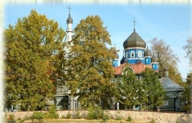
Zabytkowa Cerkiew w Puchłach

...w regionie Puszczy Białowieżskiej nie ma miejsca na nudę!