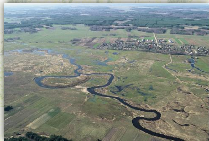
Koryto rzeki Narew

17-200 Hajnówka, ul. 3 Maja 45 tel. + 48 85 682 43 81 , fax +48 85 682 51 41 e-mail: turystyka@powiat.hajnowka.pl www.lot.bialowieza.pl